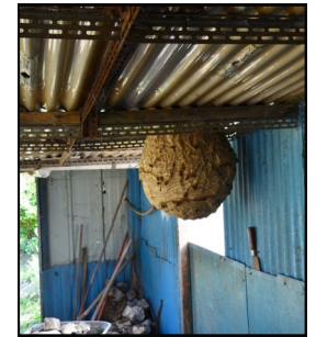
Nid sous un abri