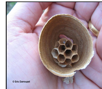
Nid de fondation

Octobre : le nid peut mesurer jusqu'à 1 m de haut !