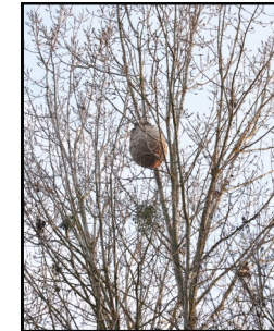
Nid dans un arbre