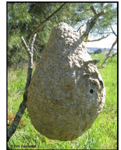
Nid en fin d'année

Les nids de taille importante, découverts entre janvier et mars ne sont plus habités et ne seront pas recolonisés au printemps suivant. Il n'est alors plus nécessaire de les faire détruire.