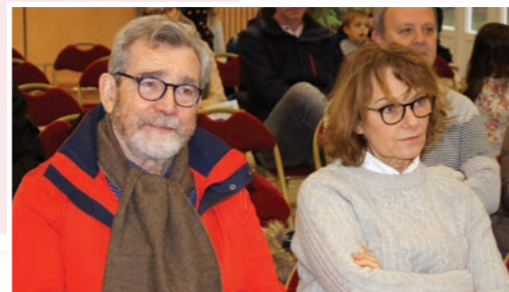
Le maire a présenté la commune et ses projets lors de l'accueil des nouveaux habitants le 27 janvier.