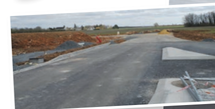
Les travaux de voirie ont débuté pour l'extension de la zone d'activité d'Even Parc.