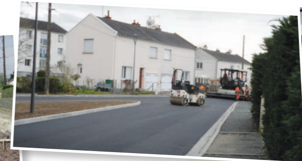
Enrobé et massifs terminés cité Louis Germain. Dépose des câbles suite à l'enfouissement des réseaux électriques et téléphoniques.