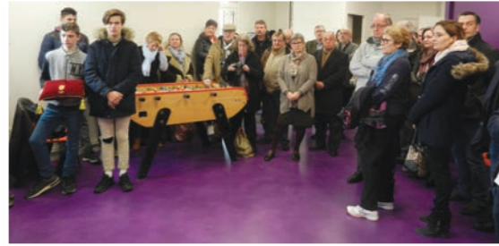
Le 17 février, le maire et ses adjoints inauguraient l'espace jeunes d'Esvres sur le plateau sportif. Il remplace l'ancien accueil jeune en dessous de la salle des fêtes.