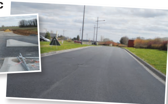
Enrobé définitif sur les voiries