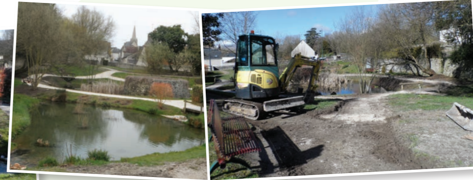
Nettoyage et curage des bassins, réfection des allées par le service technique de la mairie.