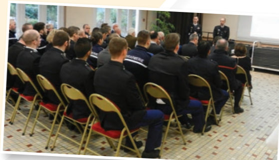
La brigade de gendarmerie de Cormery Montbazou a présenté devant les élus le bilan annuel de ses actions sur leur territoire de compétence, le 25 janvier.