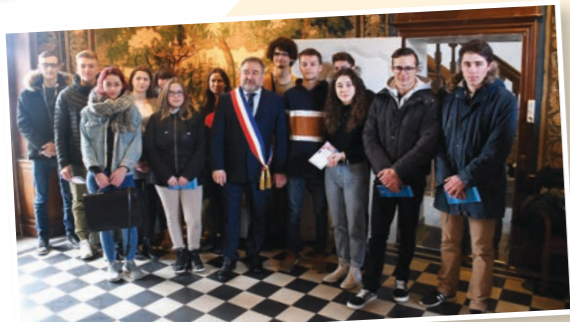
Le Maire et les adjoints ont remis leur carte d'électeur aux jeunes citoyens de la commune, le 4 mars.