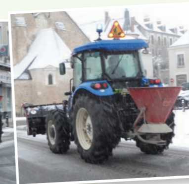
Opération de déneigement et de sablage.