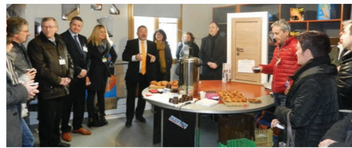
Dans les locaux de la société Maytop avec les entrepreneurs de la zone d'activité, le 22 février