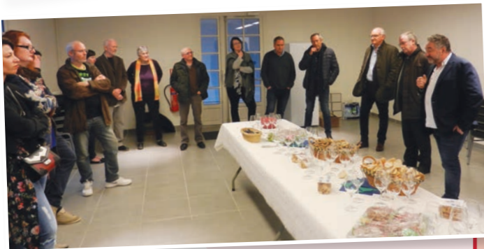
Rencontre avec les commerçants du centre-bourg, 27 mars