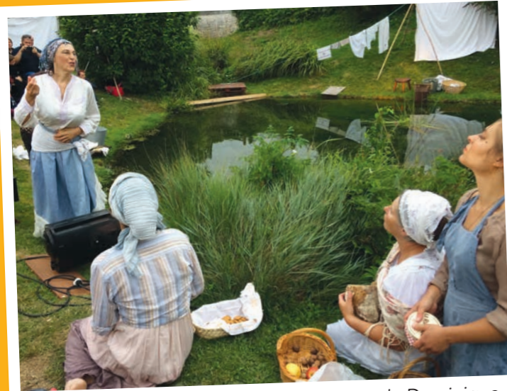
Représentation de la pièce « Le Lavoir » de Dominique Durvin et Hélène Prévost par la Maison des Talents. Mise en scène de Thierry Tchang Tchong – 12 juillet