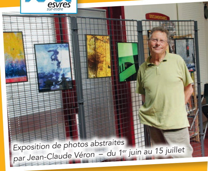
Exposition de photos abstraites par Jean-Claude Véron – du 1 er juin au 15 juillet