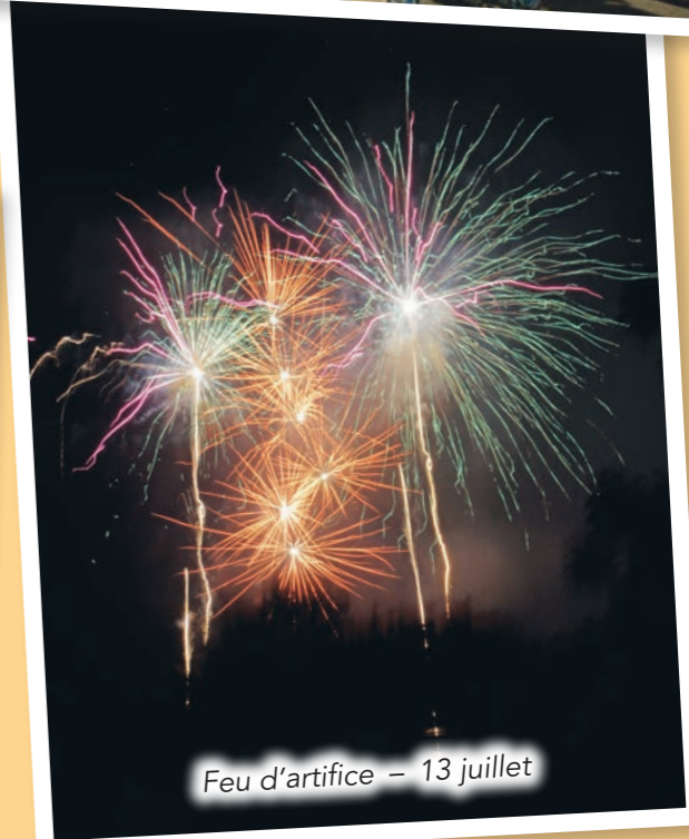
Feu d'artifice – 13 juillet