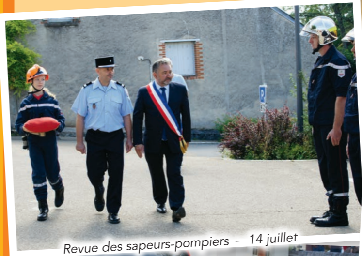
Revue des sapeurs-pompiers – 14 juillet