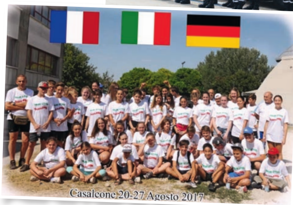
Stage linguistique Casaleone - 20 au 27 août