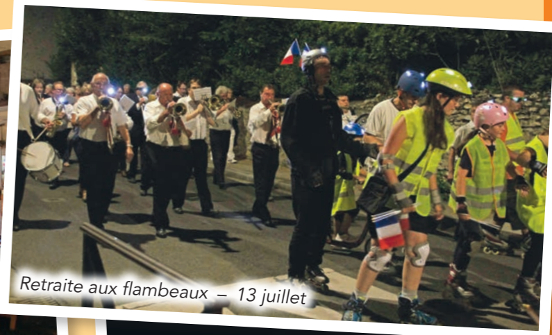
Retraite aux flambeaux – 13 juillet