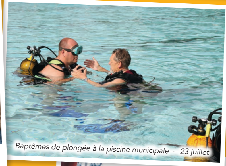
Baptêmes de plongée à la piscine municipale – 23 juillet