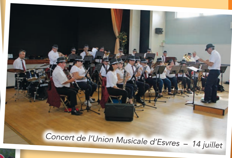
Concert de l'Union Musicale d'Esvres – 14 juillet