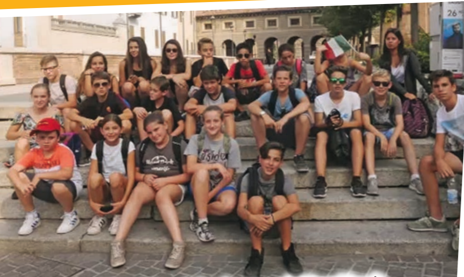
Stage multilinguistique à Casaleone – du 20 au 27 août