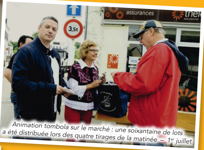
Animation tombola sur le marché : une soixantaine de lots a été distribuée lors des quatre tirages de la matinée – 1 er juillet