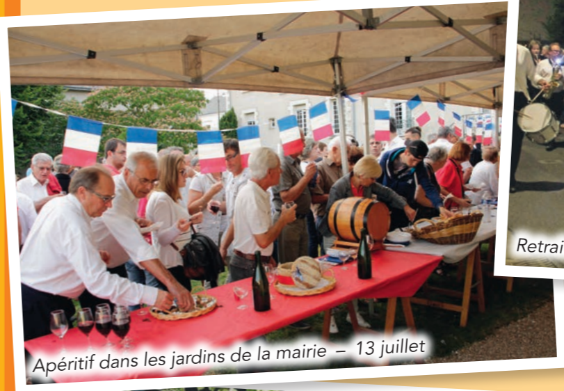
Apéritif dans les jardins de la mairie – 13 juillet