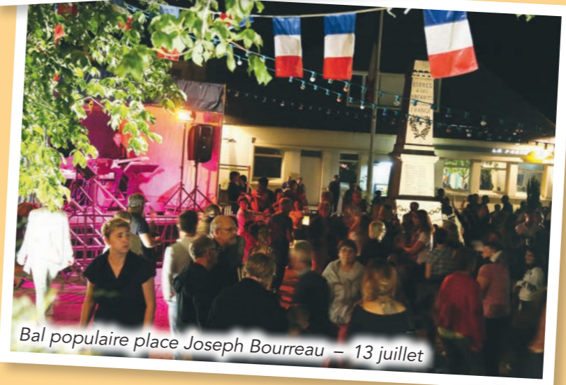
Bal populaire place Joseph Bourreau – 13 juillet