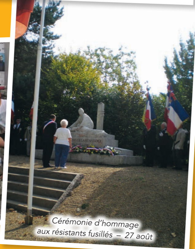
Cérémonie d'hommage aux résistants fusillés – 27 août